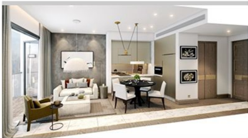
春天为概念的客厅与饭厅设计。

她补充，YOO在建设及设计品牌建筑方面非常在行，在与YOO会面后，发现双方拥有“共同语言”，因此敲定合作关系。